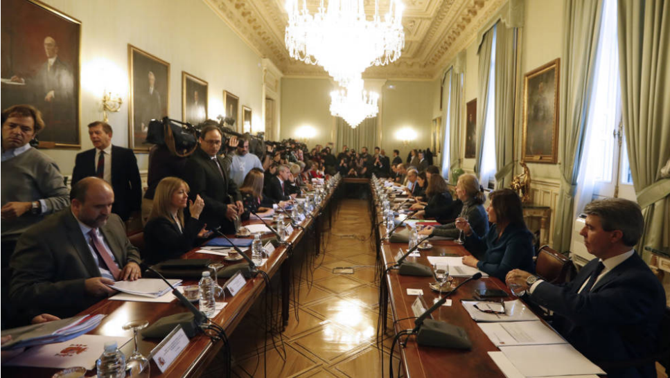
Reunión de los consejeros autonómicos para ultimar detalles de la Conferencia de Presidentes del martes.

Ocho años después de la aprobación del actual modelo de financiación, la Conferencia de Presidentes comienza a revisarlo. Se trata de un sistema complejo y hasta opaco