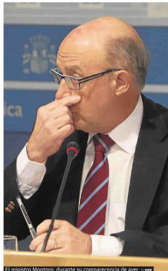
El ministro Montoro, durante su comparecencia de ayer.

En cualquier caso, el desfase de la Administración central también se debe al comportamiento de los ingresos peor de lo previsto. De hecho, la recaudación tributaria fue 2.862 millones inferior a la estimada en los Presupuestos de 2017. En