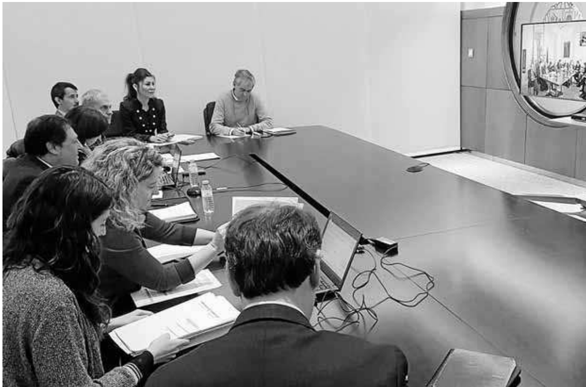
El equipo técnico del Gobierno vasco mantuvo ayer una intensa jornada de negociación por videoconferencia con el Gobierno español.

económicas. "Es una discrepancia de fondo que afecta al modelo de relación pactado en el Concierto Económico. Este modelo concertado se ha aplicado históricamente, con éxito, en todos los procesos de negociación de transferencias. Es objetivo y se ha demostrado eficaz y justo para ambas partes. Abandonar ahora este modelo supone cuestionar la base objetiva que deberá facilitar la valoración de todas las transferencias pendientes", recalcó. El Gobierno vasco, que acla-