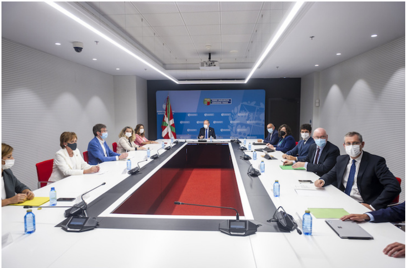
Reunión este jueves en Gasteiz del Consejo Vasco de Finanzas.