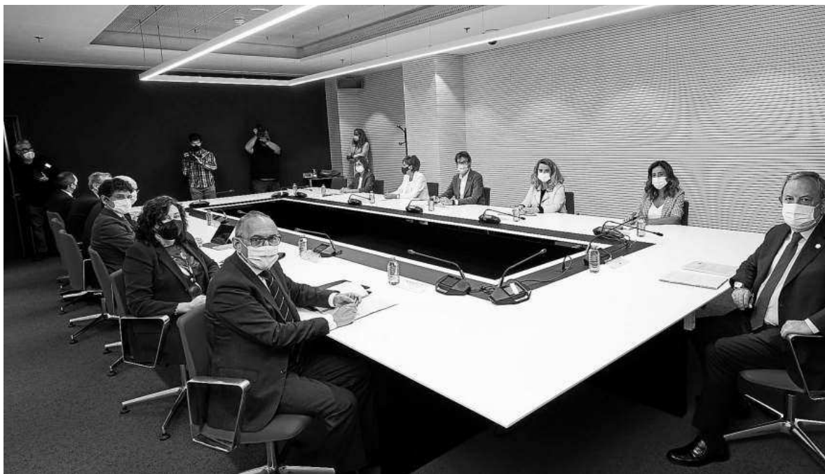
Gobierno, diputaciones y Eudel celebraron ayer en Gasteiz una reunión extraordinaria del Consejo Vasco de Finanzas.